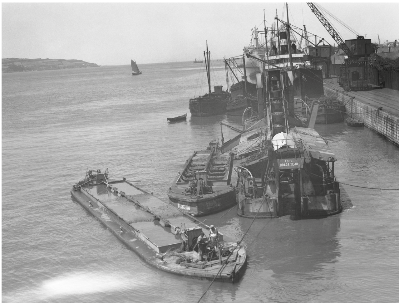
Dragagem junto ao cais de Alcântara · 21-07-1938 ·