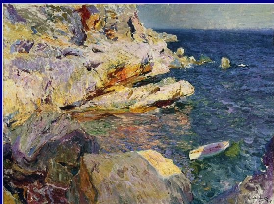
Poema de Mário de Sá-Carneiro