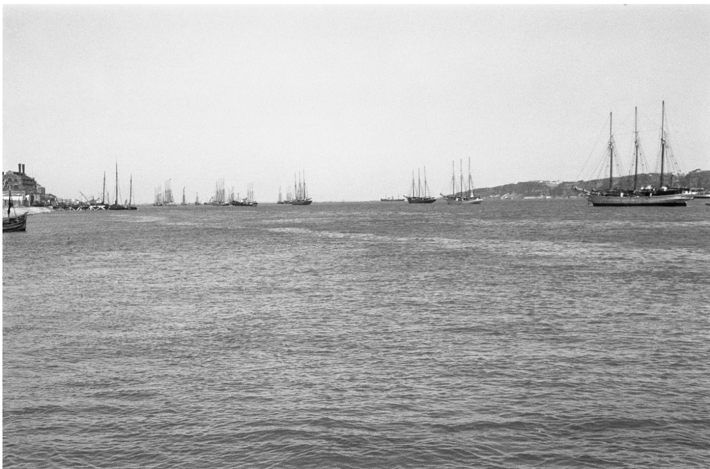
Frota bacalhoeira no Tejo