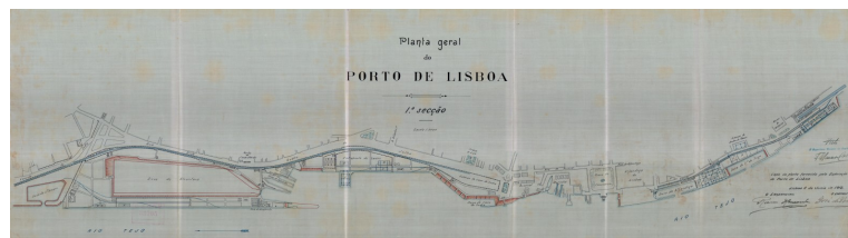
Planta Geral do Porto de Lisboa - 1ª Secção (1912)

O Arquivo dos Portos de Lisboa, Setúbal e Sesimbra tem à sua guarda um acervo cartográfico de grande importância, do ponto de vista da história dos Portos de Lisboa, Setúbal e Sesimbra, pelo que a sua preservação e inventariação constitui uma prioridade. Desta forma, deu-se já início ao projeto de digitalização e tratamento de toda a cartografia histórica à guarda deste Arquivo, correspondendo a cerca de 20.000 plantas dos três portos.