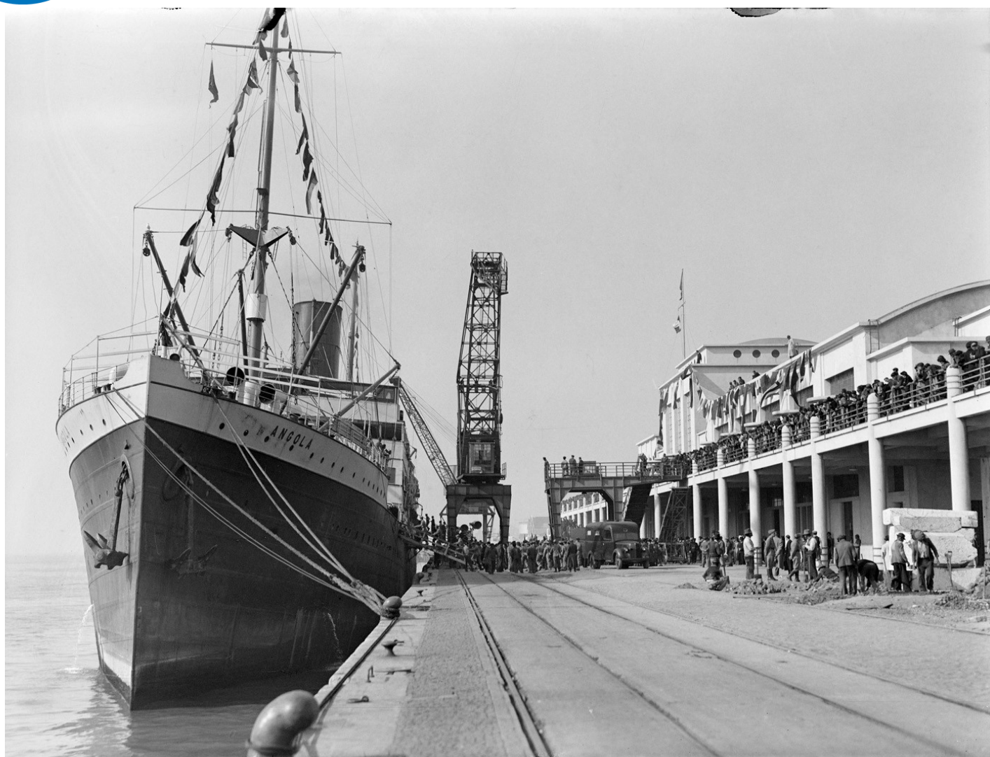
Chegada do paquete "Angola" vindo de Timor (Gare Marítima de Alcântara)