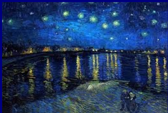
Poema de Fernanda Botelho

Surgem estrelas nas mágoas, nas mágoas do meu desterro: atravessar estas águas e reparar o meu erro (o meu erro e as suas mágoas). (...)