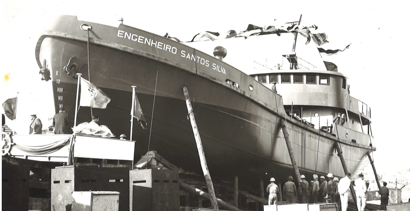
Draga Engenheiro Santos Silva - Figueira da Foz