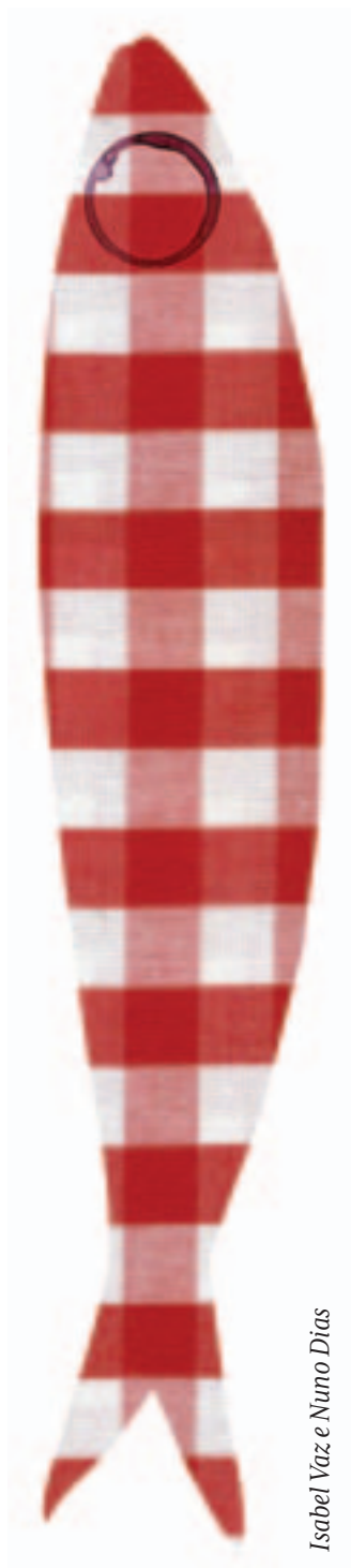
Isabel Vaz e Nuno Dias