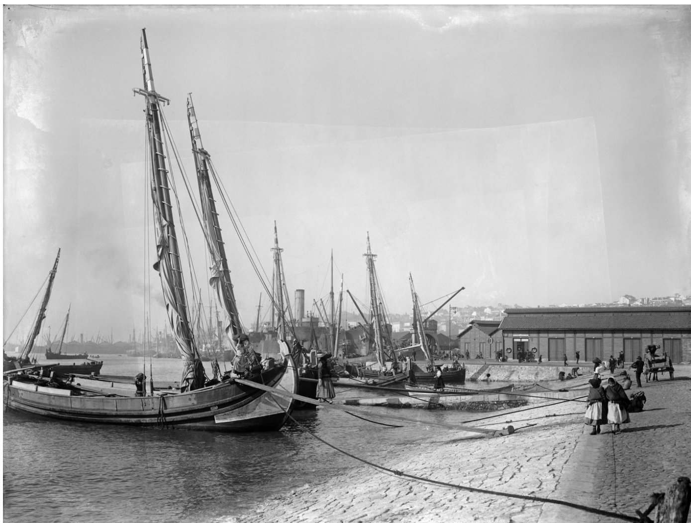
Cais da Ribeira Nova s/d