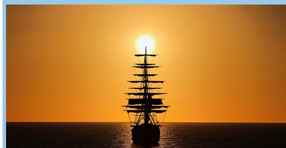
Poema de Manuel Alegre

Eu não sei se teu corpo se meu chão mas era ainda a terra e o mar. E em cada teu gesto a grande peregrinação das sete penas do amor lusíada.