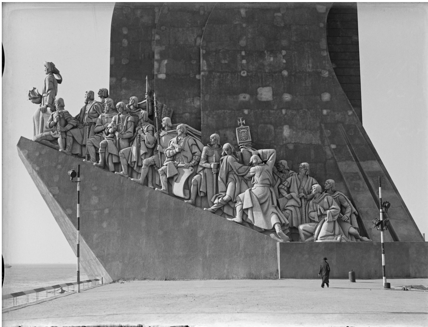
Exposição do Mundo Português - Monumento ao Infante D. Henrique