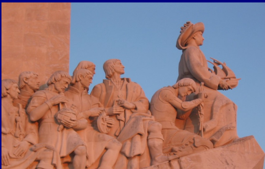
Poema de Fernando Pessoa

Quem te sagrou criou-te português. Do mar e nós em ti nos deu sinal. Cumriu-se o Mar, e o Império se desfez. Senhor, falta cumprir-se Portugal!