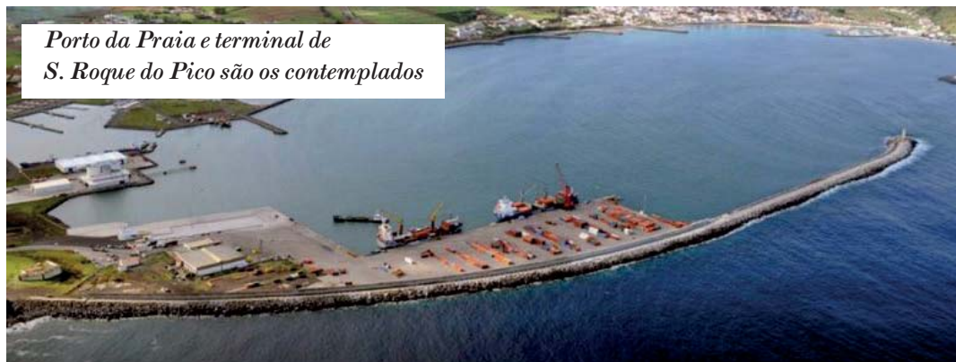
Porto da Praia e terminal de S. Roque do Pico são os contemplados

O Governo Regional acaba de atribuir mais de meio milhão de euros para "serviços de consultadoria, estudos e projectos relacionados com o desenvolvimento do porto da Praia da Vitória e do terminal de passageiros do porto de São Roque do Pico, assim como a cooperação entre ambas as partes no âmbito dessa promoção".