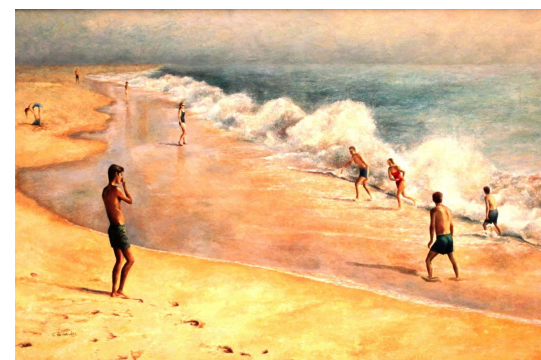
Poema de João de Barros