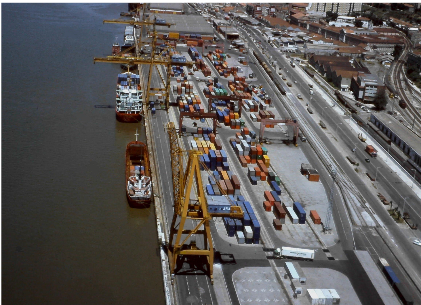
Vista aérea do Terminal de Contentores de Santa Apolónia Anos 90