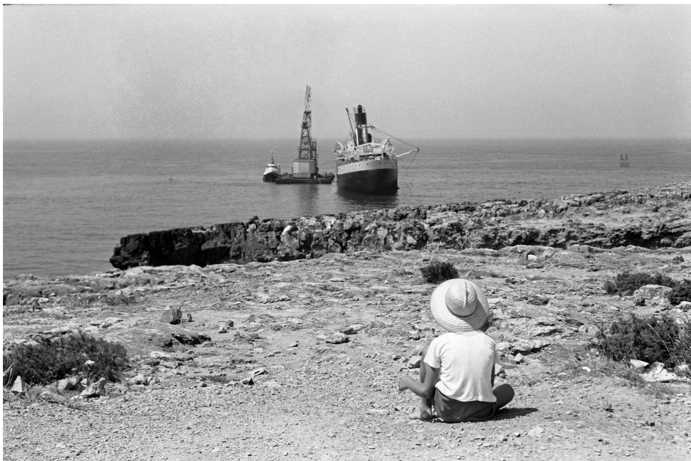
Paquete inglês Hildebrand encalhado junto ao Forte de Oitavos