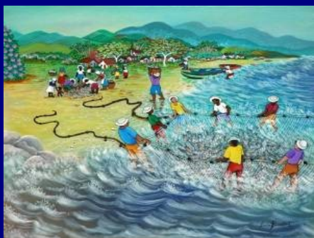
Poema de Cecília Meireles

Por isso chora, na areia, a espuma da maré cheia.