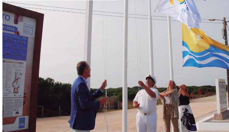
A Bandeira Azul, símbolo europeu de qualidade balnear, foi hasteada pela 17.ª vez Página 3

Praia de S. Jacinto volta a ser de qualidade “Azul”