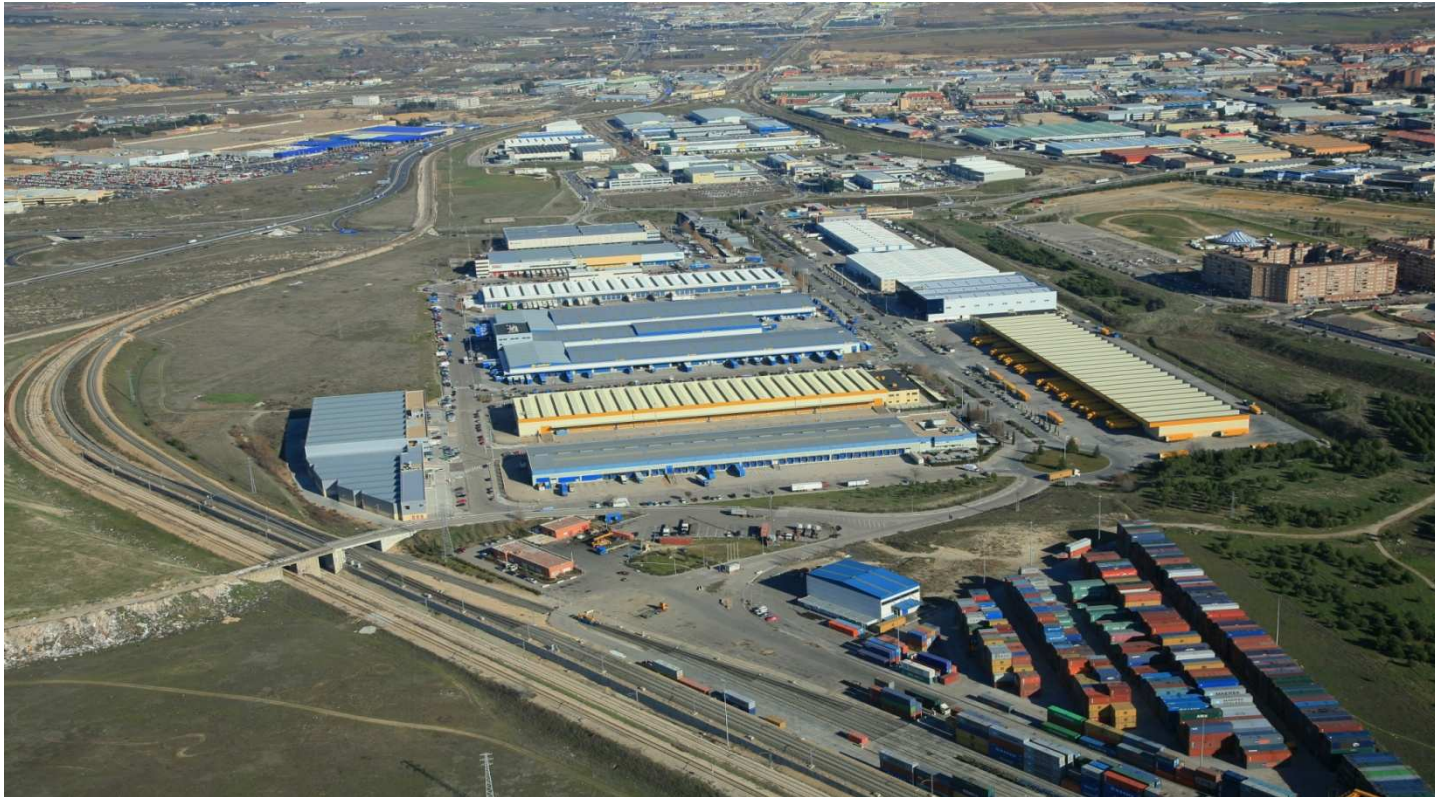
Quinta Plataforma Logística Intermodal Europea ( German Freight Villages Association )