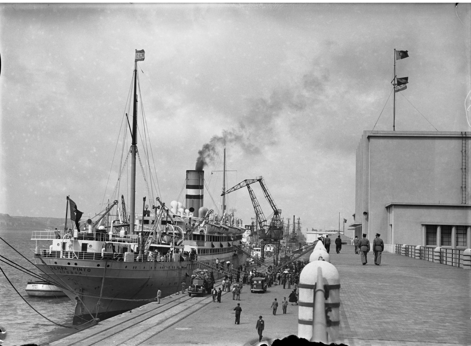
Chegada do navio "Sarpa Pinto" na Gare Marítima da Rocha