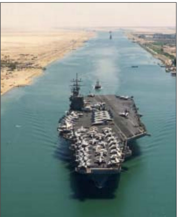
En el acumulado enero-mayo, el paso de buques por la vía egipcia se ha mantenido (+0,6%)

Durante el acumulado enero-mayo transitaron por la vía navegable egipcia un total de 7.211 buques, un leve incremento del 0,6% respecto a las 7.169 unidades de los cinco primeros meses del 2010.