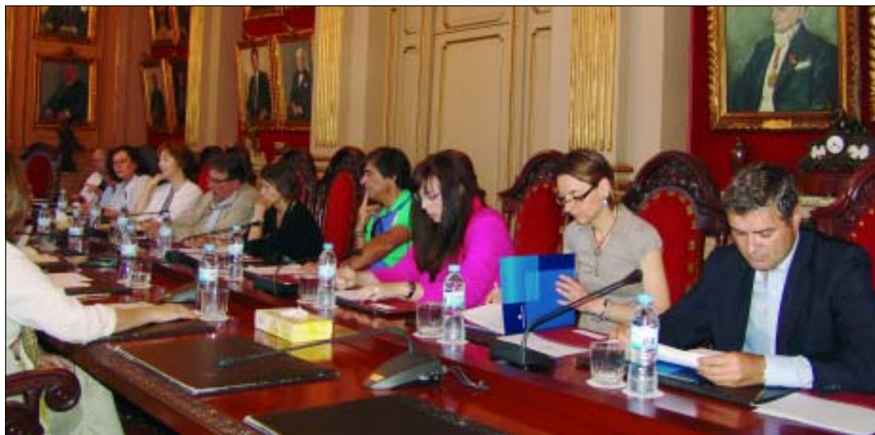
El grupo de magistrados y jueces en el edificio del Portal de la Pau de la Autoridad Portuaria de Barcelona (APB)