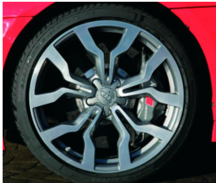
El certamen estará dedicado al segmento de recambios y componentes del sector del automóvil

Fira Barcelona suscribirá un acuerdo de colaboración con Promotec, empresa organizadora de Autopromotec, una de las ferias europeas del sector que se celebró del 25 al 29 de mayo en Bolonia. De esta manera se quiere aprovechar las del mercado español e italiano, impulsando la participación de empresas y compradores en ambos salones.