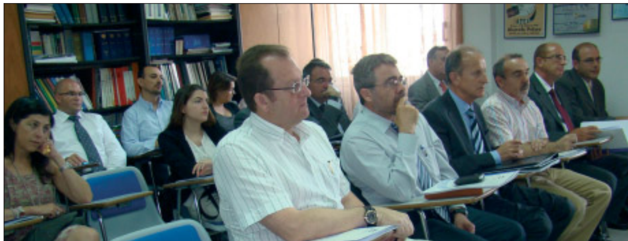
Público asistente en las instalaciones de ATEIA-OLT Valencia

Ayer jueves tuvo lugar en la Asociación de Transitarios de Valencia (ATEIA-OLT) la jornada organizada por FETEIA-OLT y el Ministerio de Fomento, «El transporte por carretera nacional e internacional. El CMR y Ley del contrato de trans-