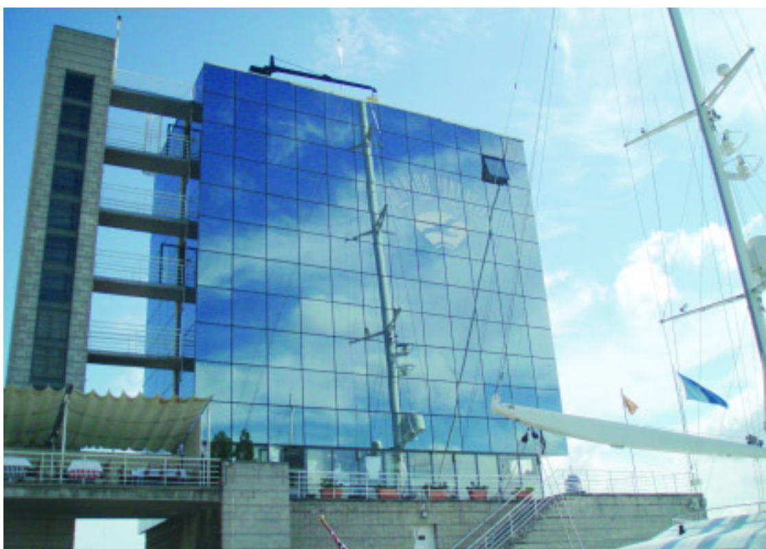
Instalaciones de Marina Port Vell en el puerto de Barcelona

Uno de los pilares principales en la gestión de la Marina Port Vell es velar por el medio ambiente y cuidar que las repercusiones producidas por su actividad, queden minimizadas en su mayor proporción. |