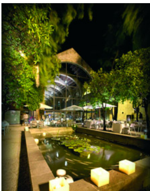
El restaurante del Museu Marítim tiene un destacado papel en el proyecto

El Consorci de les Drassanes Reials i Museu Marítim de Barcelona y la Fundació Alicia, Alimentació i Ciència, firmaron un acuerdo de colaboración, con el objetivo de trabajar conjuntamente para la difusión de la gastronomía marítima y la promoción del proyecto Norai.