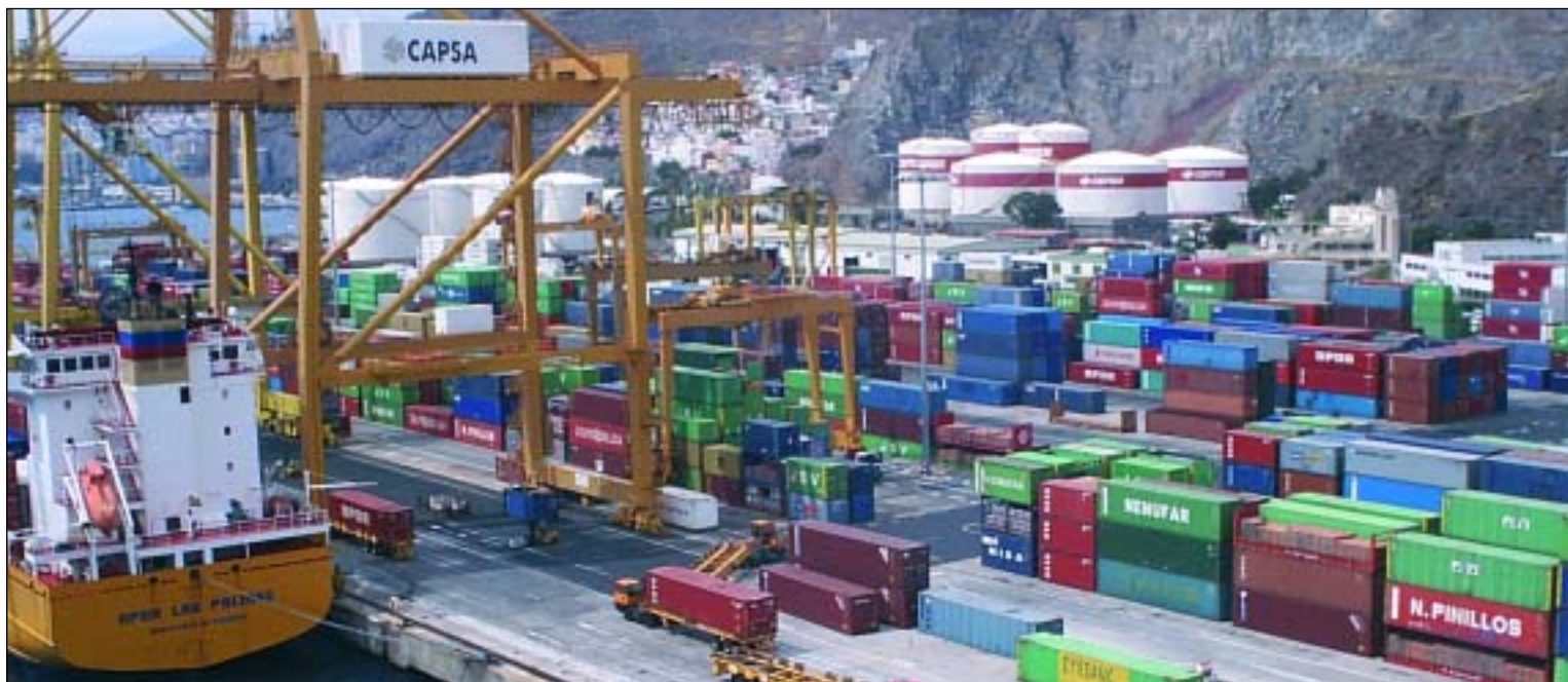
CAPSA, perteneciente a Grup TCB, movió un total de 29.889 contenedores en el mes de marzo

Tras finalizar su fase de expansión, CAPSA sigue creciendo en cuanto a mercancía rodante y cantidad de contenedores. Si durante el primer trimestre del 2010 se contabilizó un