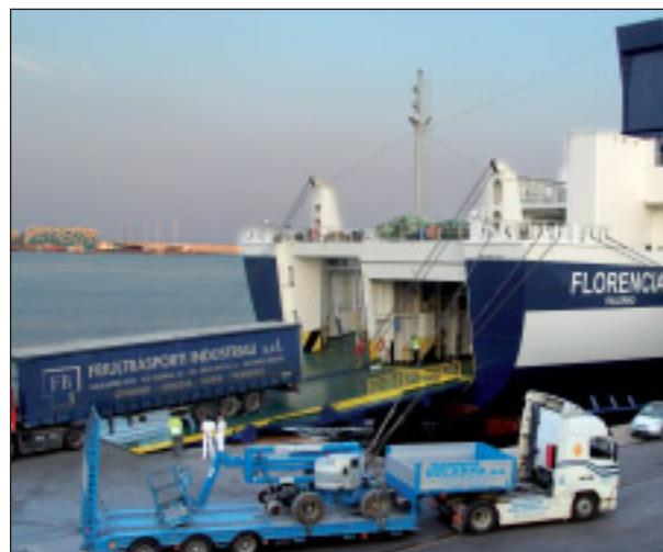
Las jornadas de short sea shipping han sido impulsadas por Puertos del Estado y por la Fundación Philippe Cousteau