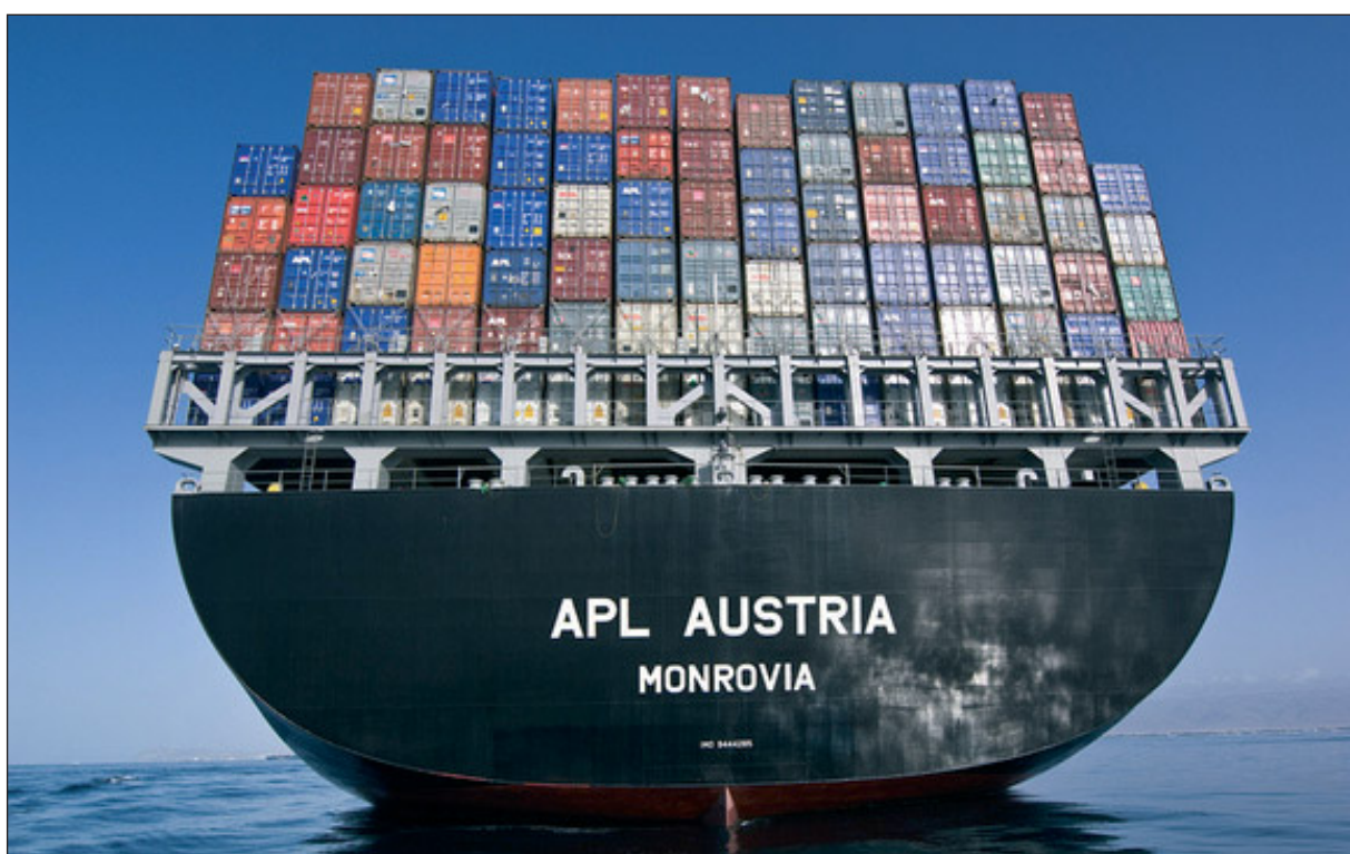
El agente para España es APL Ltd., Sucursal en España

NOL invertirá un total de 1.540 millones de dólares tanto en la cartera de los doce nuevos pedidos de portacontenedores como en el incremento de capacidad de los buques