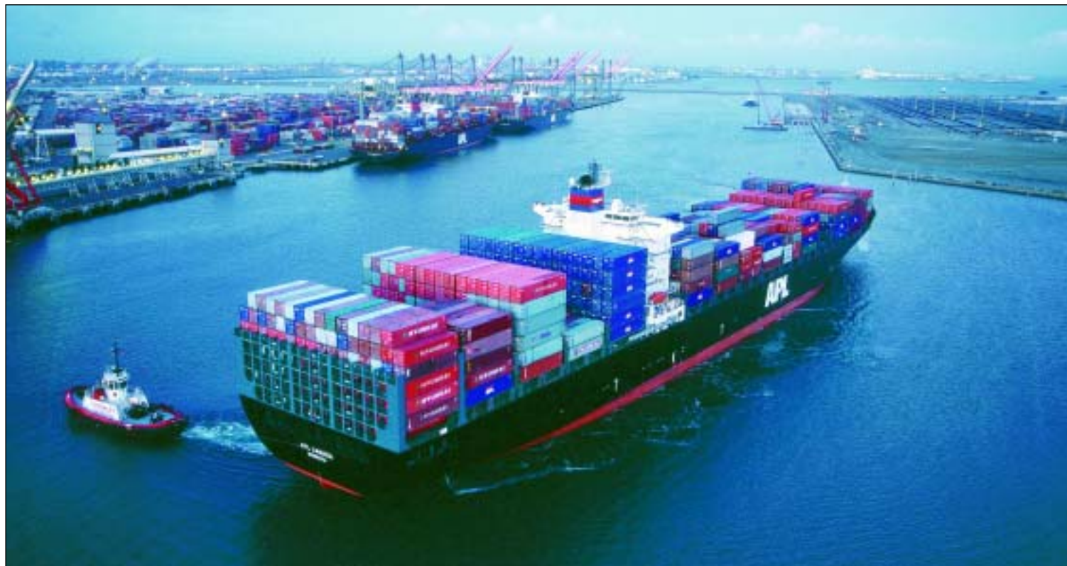
El grupo naviero de Singapur incorporará 10 buques nuevos con capacidad para 14.000 contenedores y 2 para 9.200 contenedores