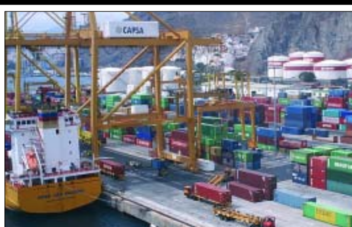
CAPSA, del grupo TCB, movió un total de 29.889 contenedores en marzo

La terminal de Grup TCB en Tenerife bate su récord mensual de contenedores