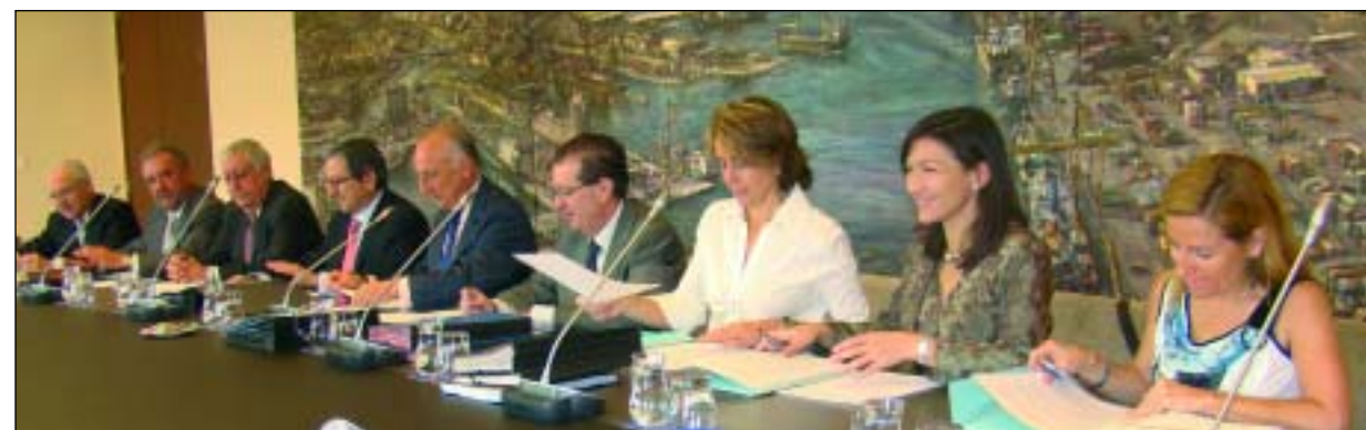
El Consejo de Administración de la Autoridad Portuaria de Valencia aprobó todos los puntos del orden del día

sólo afecta a los terrenos, no al equipamiento ni a los muelles. Asimismo, el presidente de la APV, Rafael Aznar, indicó que las cifras de tráfico "a 31 de mayo indican un crecimiento en tráfico total del 7,28% y en contenedores del 7,78% con respecto a los cinco primeros meses del 2010", y señaló también que el trámite de aprobación del Plan de Empresa de la APV «va por buen camino y esperamos que sea aprobado en el Consejo Rector del organismo público Puertos del Estado en julio». Sobre las cuentas, Aznar indicó también que en el 2010 «mantuvimos nuestro ritmo inversor, e hicimos inversiones por valor de 170 millones de euros, de los cuales 120 millones fueron en inmovilizado y 50 millones en compra de suelo logístico para las zonas de actividades logísticas de Valencia y Sagunto».